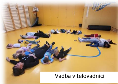
Vadba v telovadnici