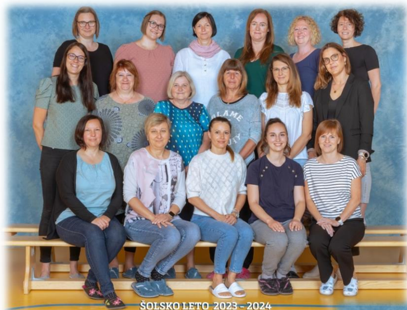
ŠOLSKO LETO 2023 - 2024