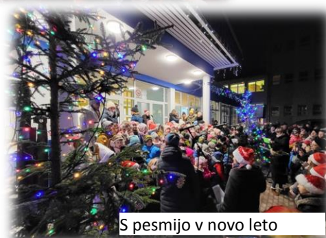
S pesmijo v novo leto