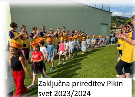
Zaključna prireditev Pikin svet 2023/2024