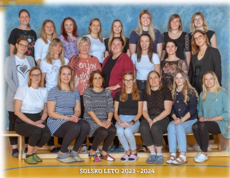
ŠOLSKO LETO 2023 - 2024