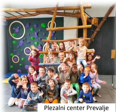
Plezalni center Prevalje