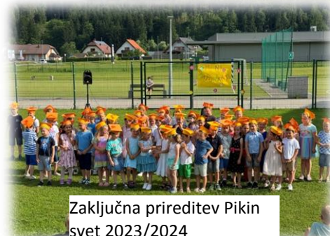
Zaključna prireditev Pikin svet 2023/2024

Poseben poudarek vsako leto dajemo delu znotraj matičnih skupin, kjer se trudimo, da se otroci dobro počutijo, imajo ogromno raznolikih dejavnosti, da se razvijajo na vseh področjih in s pomočjo močnih področij krepijo šibka, šibkejša področja.