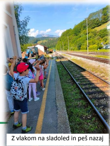
Z vlakom na sladolej in peš nazaj