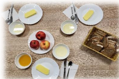
Tradicionalni slovenski zajtrk.