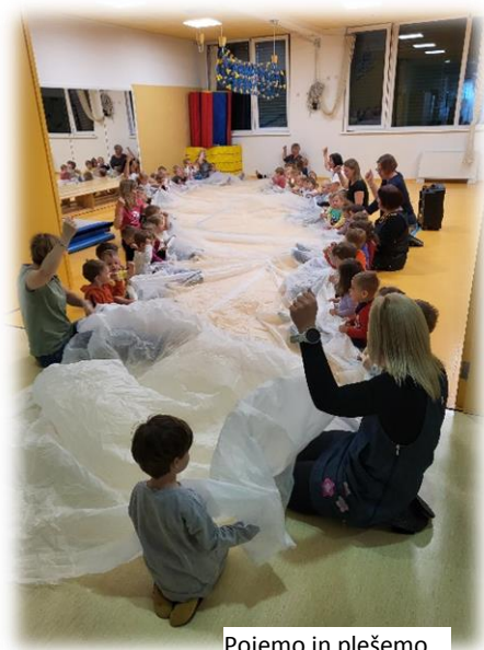
Pojemo in plešemo