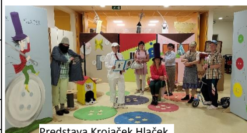
Predstava Krojaček Hlaček