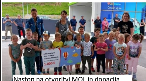
Nastop na otvoritvi MOL in donacija