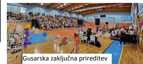
Gusarska zaključna prireditev

Poseben poudarek vsako leto dajemo delu znotraj matičnih skupin, kjer se trudimo, da se otroci dobro počutijo, imajo ogromno raznolikih dejavnosti, da se razvijajo na vseh področjih in s pomočjo močnih področij krepijo šibka, šibkejša področja.