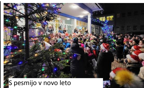
S pesmijo v novo leto