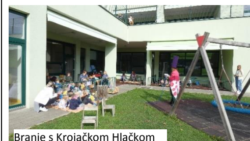
Branje s Krojačkom Hlačkom