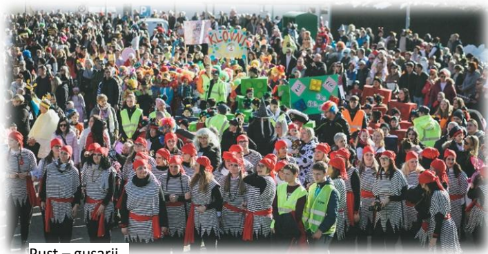
Pust – gusarji