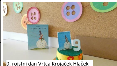
9. rojstni dan Vrtca Krojaček Hlaček