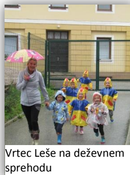
Vrtec Leše na deževnem sprehodu