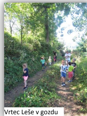
Vrtec Leše v gozdu