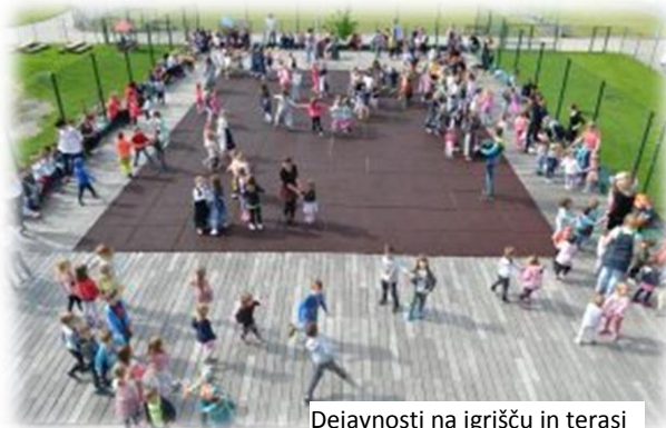
Dejavnosti na igrišču in terasi