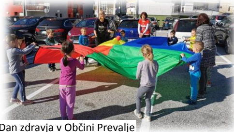
Dan zdravja v Občini Prevalje