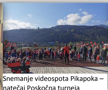
Snemanje videospota Pikapoka – natečaj Poskočna turneja