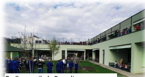
Godba na pihala Prevalje