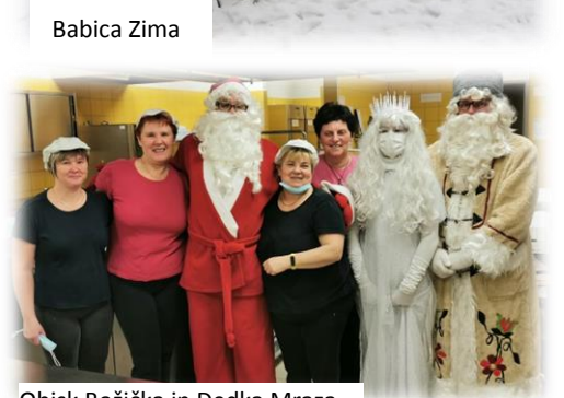
Obisk Božička in Dedka Mraza