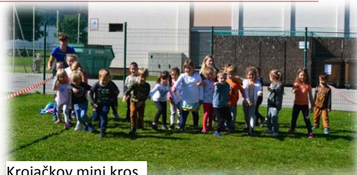
Krojačkov mini kros