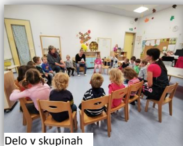
Delo v skupinah