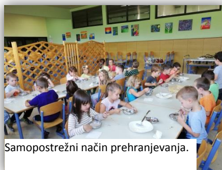
Samopostrežni način prehranjevanja.