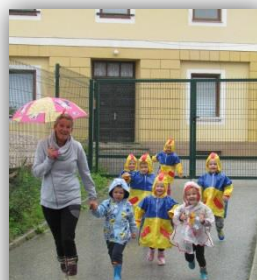
Vrtec Leše na deževnem sprehodu