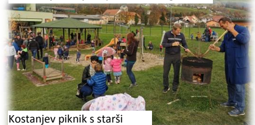
Kostanjev piknik s starši