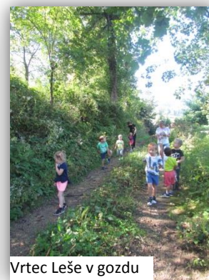
Vrtec Leše v gozdu