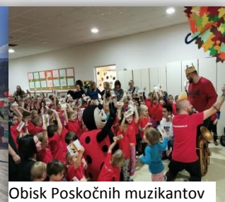
Obisk Poskočnih muzikantov