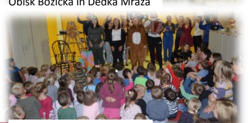
Gledališke predstave v vrtcu