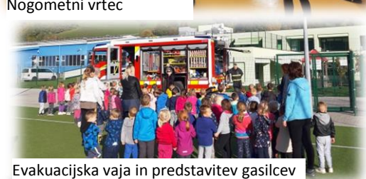
Evakuacijska vaja in predstavitev gasilcev