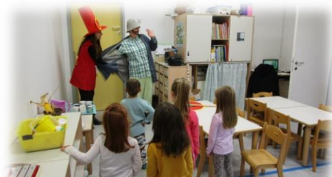
Obisk Krojačka Hlačka in Razbojnika Cincina